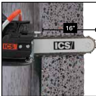
Corte profundo para abrir aberturas obstruidas o estrechas